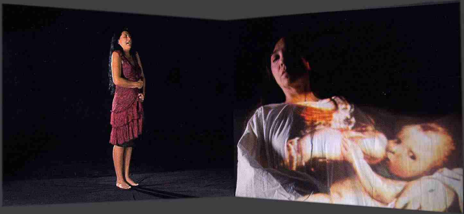
Carmen Sigler, Invocación , 2006. Boceto de la videoinstalación.